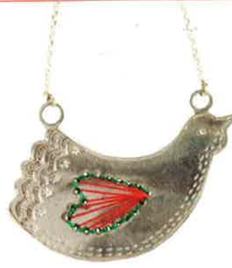
PENDENTIF ◀ PAR AUDE DUROU