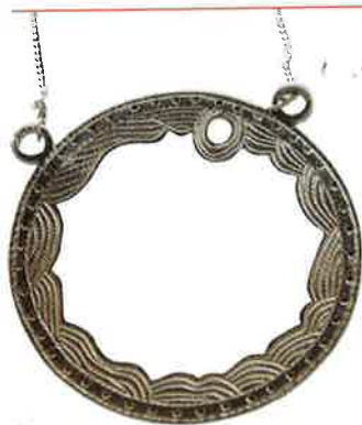
COLLIER DUNE ◀ PAR AUDE DUROU