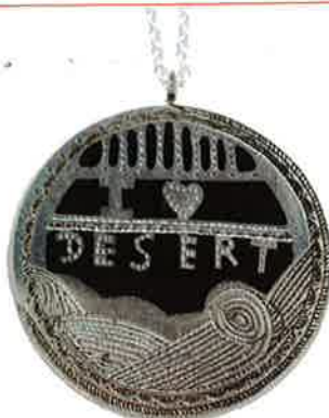
I LOVE DESERT ◀ PAR AUDE DUROU